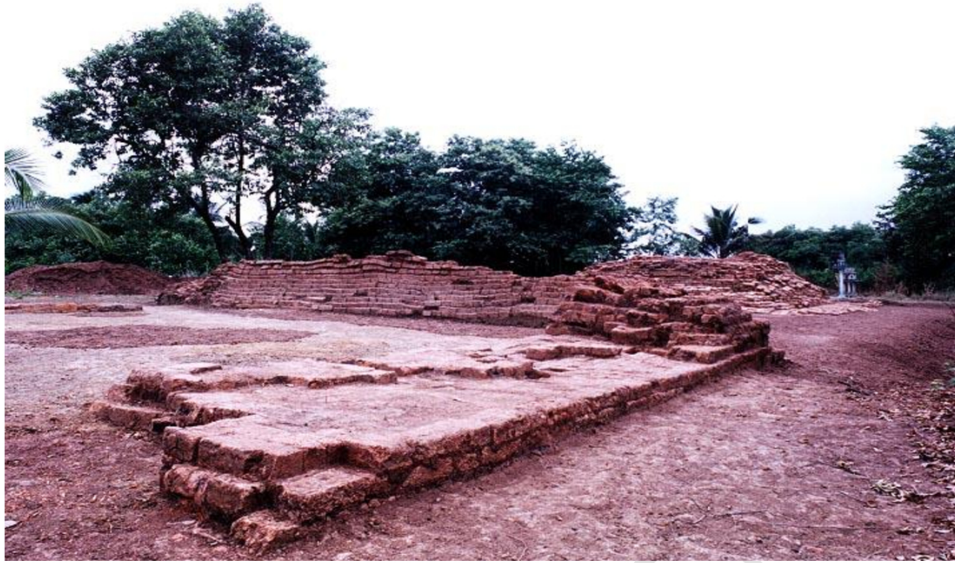
โบราณสถานหมายเลข 25 เมืองคูบัว สภาพหลังจากการขุดแต่ง